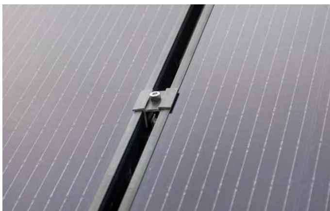
Bild 8. Mittklämma monterad.