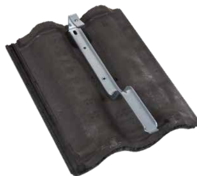
Bild 2. Läktfäste under den förstärkta betongpannan.