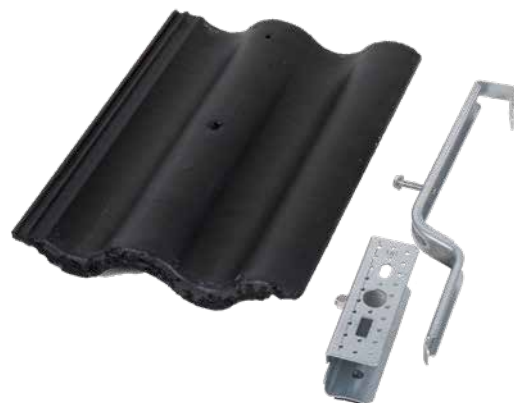
Bild 1. Infästningspanna Solar består av 3 delar.

Montera Infästningspannorna enligt Snö- och vindlastberäkning på läkten. Justering av höjd av konsolen i förhållande till taket görs med bult enligt bild 4.