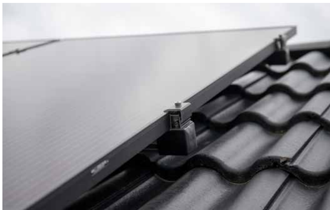
Bild 7. Ändklämma med monterat Ändlock

Tryck ned mittklämma i skenan och vrid 90°. Placera Mittklämma mot den första panelen och tryck emot den andra panelen. Skruva fast (15Nm) mittklämma (bild 8).