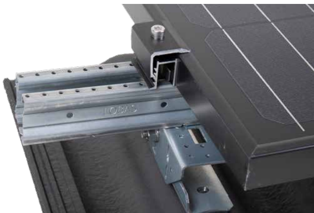
Bild 6. Montering av Ändklämma.

Placera första solpanelen minst 70 mm in från skenans avslut, och skruva fast (15Nm) panelen med Ändklämma (bild 6). Vid behov, kapa skenan, och trä därefter på Ändlock (bild 7).