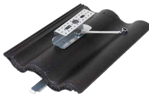
Bild 3. Skruva fast konsolen på ovasidan.